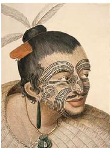
3. sz. ábra: Maori tetoválás

Régen az emberek többnyire a pubertás idején kezdték tetováltatni magukat, és főképpen beavatási rítusnak, kockázatvállalási viselkedésnek fogták fel, és ezzel átérezték, hogy a társadalom teljes értékű tagjává váltak. Meghatározták ezzel a közösségben a helyét, identitáshoz jutott, és kifejezték ezzel a nemi érettségét is. „A törzsi ember szerint a tetovált ember szép, míg a jelöletlen ember csúnya, nem számíthat a másik ember figyelmére.” 12