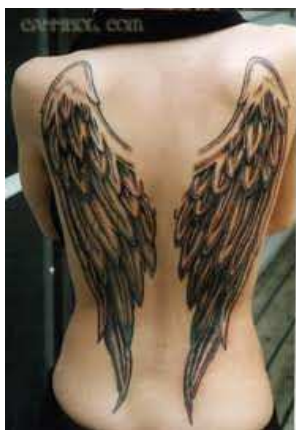
6. sz. ábra: Angyalszárny. Forrás: 29

Nagyon sok tetovált ember nem áll meg az első tetoválásnál, hanem szinte függőséget alakít ki a tetoválással kapcsolatban, mivel úgy érzi, hogy minden krízishelyzetet, illetve minden fontos, érzelmileg ható eseményt (szerelem, veszteségélmény stb.) meg kell örökítenie a testén. Az új tetoválás öröme egy időre elfedi, megoldja a problémákat, és az egyénnek javítja az önmagáról alkotott képét. Bizonyos idő elteltével viszont visszalép az eredeti kiinduló állapotba, és úgynevezett circulus vitiosus, ördögi körré válik. Ez hasonló, mint a neurotikus ember rosszul alkalmazott (maladaptív) konfliktus-megoldási módja.