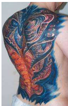
7. sz. ábra: Testfedés. Forrás: 30

Krízishelyzet hatására, ha szenvedés árán is, az illető színesedik, differenciálódik. A mindennapok emberének szublimációs lehetősége manapság a