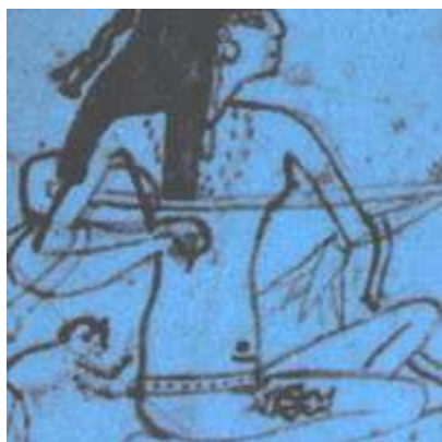
1. sz. ábra: Tetovált nő, Forrás: 7

A teljesség igénye nélkül említünk néhány olyan történelmi időszakot, amikor nagyobb szerepet kapott a tetoválás, amely a közösségi ízlés kifejezője volt, hozzátartozott a divattörténethez. A tetoválás mindig is létezett a történelem során, amit többnyire primitívnek tartottak. Az egyik legősibb ismert ember, aki tetoválást viselt, Ötzi, az 1990-ben az Alpok magas hegyei között talált férfimúmia. Korát kb. 5300 évre becsülik. További tetoválással kapcsolatos leleteket Kr.e. 4000 táján találták - ezek zömében ágyasokat, táncosnőket díszítettek.