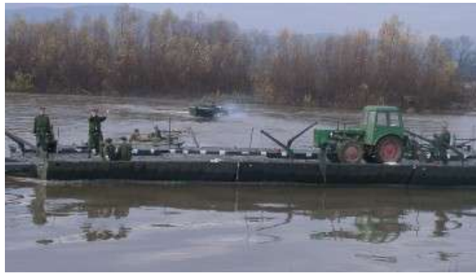
14. ábra. A Tisza zászlóalj gyakorlata.

Megemlítendő még, hogy a magyar katonák nemzetközi együttműködés formájában is részt vesznek a katasztrófavédelmi feladatokban. 1999-ben jött létre Magyarország, Románia és Ukrajna részvételével a „Tisza” Többnemzeti Műszaki Zászlóalj, amelyhez később Szlovákia is csatlakozott. Az erre vonatkozó nemzetközi egyezmény nyitott a régió bármely állama részére, amely hajlandó és képes részt venni az alakulat tevékenységében. A zászlóalj megalakításának célja egy olyan többnemzeti katonai képesség létrehozása és működtetése, amelyben az egyes nemzetekből kijelölt erők támogatják egymást a Tisza vízgyűjtő területén bekövetkezett katasztrófa esetén, továbbá részt vesznek a következmények felszámolásában, a károk enyhítésében, megszüntetésében. A zászlóaljat alkotó nemzetek képviselői rendszeresen találkoznak az alakulat működtetésével kapcsolatos kérdések megvitatása, közös tapasztalatcsere, illetve közös gyakorlatok végrehajtása céljából. Az viszont elgondolkoztató, hogy a Tisza Zászlóalj éles helyzetben történő bevetésére eddig nem volt példa, holott a megalakulása óta nagyobb árvíz többször is előfordult a Tiszán és környékén.