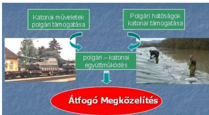
1. ábra. A Polgári Veszélyhelyzeti Tervezés feladatrendszer. (Keszely László, 2013.)

A kollektív védelemi erőfeszítések terén napjainkban is a szárazföldi, tengeri és légi szállítás civil eszközökkel történő támogatása az egyik legjellemzőbb feladat. Mellette azonban egyre nagyobb jelentőségre tesz szert a kritikus infrastruktúrák védelme, vagy a terrorizmus elleni harc. Ez utóbbira jó példa az Active Endeavour fedőnevű, V. Cikkely szerinti terrorellenes művelet a mediterrán térségben, ahol civil hajózási szakértők adnak tanácsot a szövetséges haditengerészeti erők részére a hajók átkutatásával kapcsolatos kereskedelmi és nemzetközi jogi szabályokról, eljárásokról.[3]