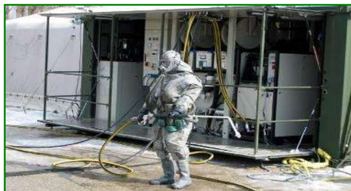
7. ábra. Atom-, biológiai-, vegyi mentesítő csoport

Az atom-, biológiai-, vegyi mentesítő csoport feladata technikai eszközök, személyi állomány, anyagok és felszerelések, szilárd burkolatú utak, objektumok sugármentesítése.