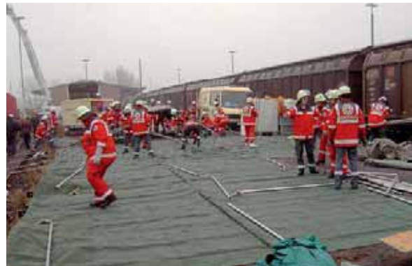
Gemeinsame Übung: Berufs- und freiwillige Rettungsorganisationen

Die Mitwirkung der öffentlichen und privaten Organisationen bei der Erfüllung der Aufgaben richtet sich nach den landesrechtlichen Vorschriften für den Katastrophenschutz. Die mitwirkenden öffentlichen und privaten Organisationen bilden die erforderliche Zahl von Helferinnen und Helfern aus, sorgen für die sachgerechte Unterbringung und Pflege der ergänzenden Ausstattung und stellen die Einsatzbereitschaft ihrer Einheiten und Einrichtungen sicher. Die Bürger werden motiviert, in diesen Organisationen teilzunehmen. Die Organisationen bekommen eine bestimmte Summe vom Staashaushalt, um ihre Traditionen pflegen zu können, einheitliche Uniformen kaufen zu können, und die Ausbildung der Mitglieder erfolgreich wahrnehmen zu können.